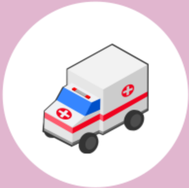
きゅうきゅうしゃ